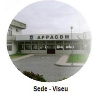
Sede - Viseu