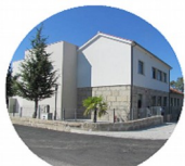
Estabelecimento de Vila Pouca Santa Comba Dão