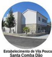
Estabelecimento de Vila Pouca Santa Comba Dão